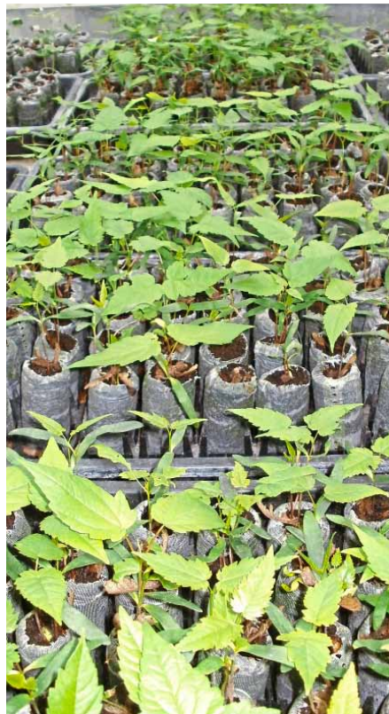
Abb. 2: Quelltöpfe (Jiffy-7®) mit Bergahorn-Sämlingen

Das Anzuchtsubstrat muss ein hohes Porenvolumen, eine ausreichende Belüftung, eine hohe Wasserhaltekapazität, eine geringe Zersetzbarkeit sowie einen niedrigen pH-Wert aufweisen [14]. Für die Anzucht in den Hartwandtöpfen wurde eine handelsübliche Anzuchterde mit einem pH-Wert von 5,8 verwendet. Darin enthalten sind die Nährstoffe Stickstoff mit 210 mg/l, Phosphor ( P_2O_5 ) mit 240 mg/l und Kali ( K_2O ) mit 270 mg/l. Die Summe aller weiteren Spurenelemente beträgt 1,5 g/l [15]. Zusätzlich enthält die