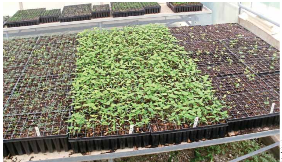
Abb. 1: Hartwandtöpfe (Quickpot®) mit Bergahorn-Sämlingen